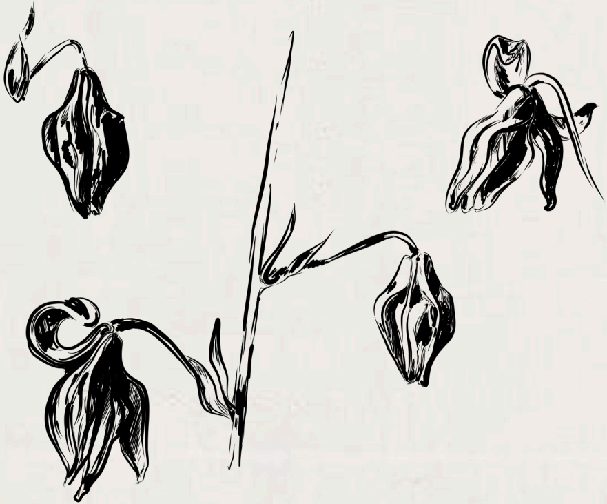
Stanisław Witkiewicz, rysunek lilii złotogłów (lilium martagon)